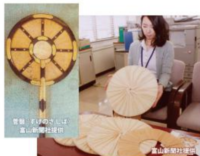
菅笠「まげのさしぼ」

「菅翳」は、社殿の修復「ご造営」と共に初めて修繕されるもので、スゲが縫い付けられた直径約45cmの円盤に、漆塗りの枠と柄が付いた神具です。神官らが行列する際に、頭上や左右に顔を隠したり、日除けとして使用されます。