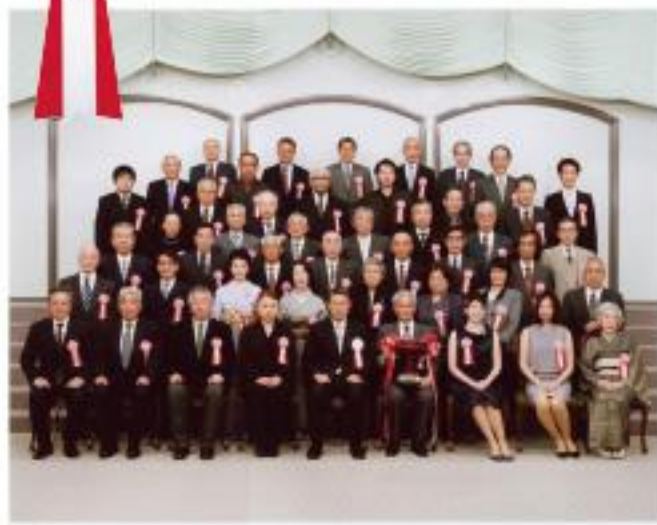
平成24年度 一級技能士 伝統的工芸品産業大賞授賞式 平成24年12月21日 明治記念館